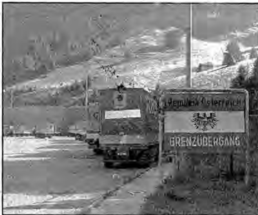
Qui a fianco, il vecchio confine austriaco; sotto, una fotografia di Pagnèrto

L'unione europea si gioca oggi su quelle montagne che, un tempo barriere naturali di difesa delle identità nazionali, diventano ora verti e propri punti tra popoli, lingue e culture vicine tra loro. La cooperazione transfrontaliera è un elemento fondamentale per l'integrazione e la coesione all'interno di un'Europa Unita allargata e lo sviluppo di politiche europee unitarie richiede necessariamente l'intervento diretto degli enti locali più sensibili alle dinamiche e alle problematiche proprie delle regioni di confine" così Werner Staudner, presidente dell'Eurac ha dato avvio all'incontro che ha visto la partecipazione di esponenti istituzionali delle regioni italiane e dei Ministri interessati, Alfari Esteri, Ambiente e Politiche Regionali nonché di qualificare rappresentanti di Svizzera e Francia. La prima parte dell'incontro è stata incentrata sulla presentazione dello studio realizzato dall'Eurac e finalizzato all'elaborazione di un modello giuridico-istituzionale applicabile ad un'area di montagna transfrontaliera e basato sui principi di cooperazione e di sviluppo sostenibile. Come è dimostrato dallo studio, le esperienze di cooperazione transfrontaliera finora messe in atto, come l'Espase Mont